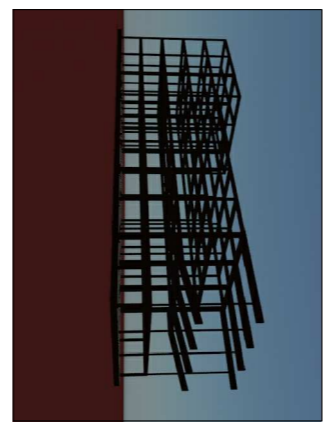
STRUTTURA IN CEMENTO ARMATO IN SO VISTA 2