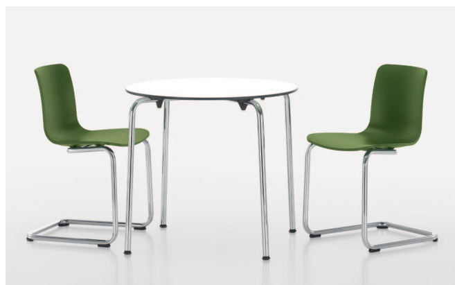
HAL Table si presta particolarmente anche per l'arredamento di ambienti pubblici, le sue gambe possono essere infatti smontate semplicemente e velocemente per custodirle in magazzino.

Nel Vitra Test Center ogni prodotto Vitra viene sottoposto a speciali verifiche che simulano un'usura di 15 anni. Così anche le superfici e i singoli elementi di HAL risultano particolarmente resistenti; le basi e le scocche non presentano punti di ristagno dello sporco e sono facili da pulire. Grazie all'etichetta ecologica GREENGUARD, HAL è utile ai fini della certificazione degli edifici ecosostenibili ai sensi del sistema LEED, i suoi materiali sono smaltibili tramite raccolta differenziata e riciclabili.