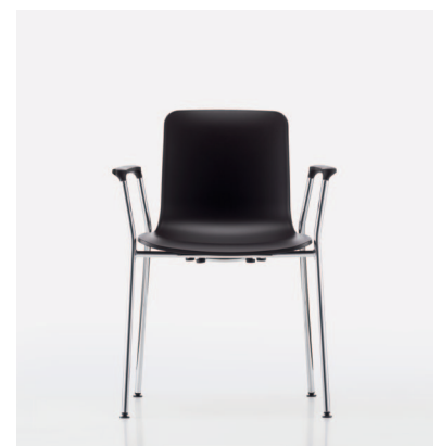
Anche la variante con braccioli è accatastabile.