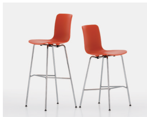
Le due varianti alte di HAL si addicono a bar e banconi.